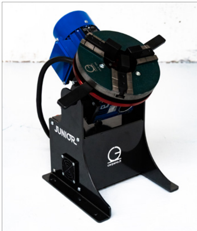
Mandrino Grip 200 : montato direttamente sulle asole della tavola, senza bisogno di flangia