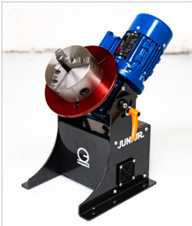
Mandrino CHK-ST-125 : montato direttamente sulle asole della tavola, senza bisogno di flangia

Posizionatore ONE (a sx) e Junior (a dx) a confronto